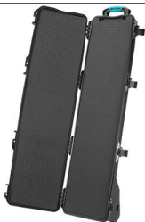
* cubed foam