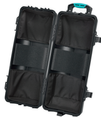
* tri version